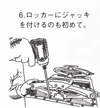
6. ロッカーにジャッキを付けるのも初めて。