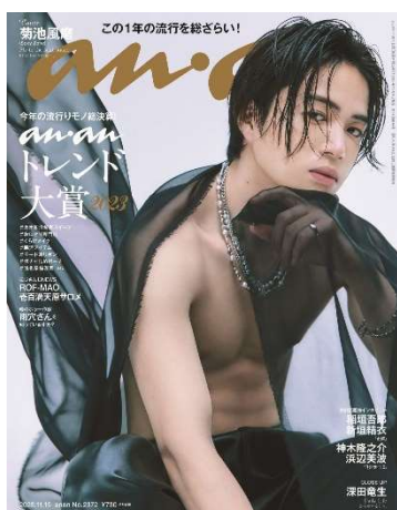
本誌表紙/菊池風磨 (Sexy Zone)