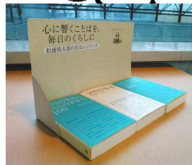
※上記2点の画像は使用イメージです。