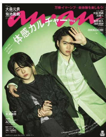
①本誌 / 大森元貴 × 菊池風磨